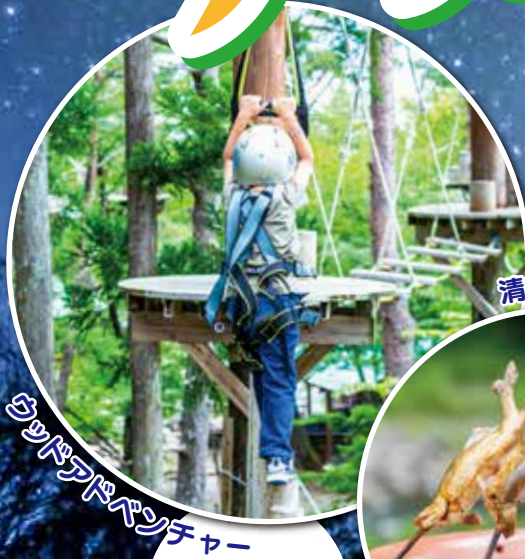
ウッドアドベンチャー