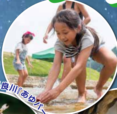
清流長良川「あゆパーク」